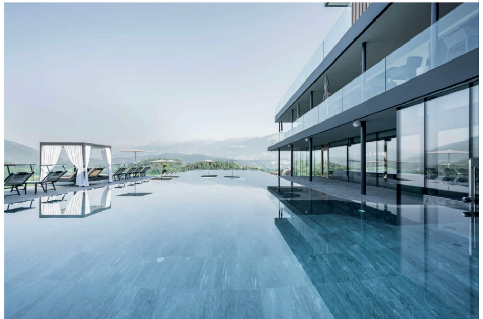
Hotel Winkler, Plan de Corones (BZ)