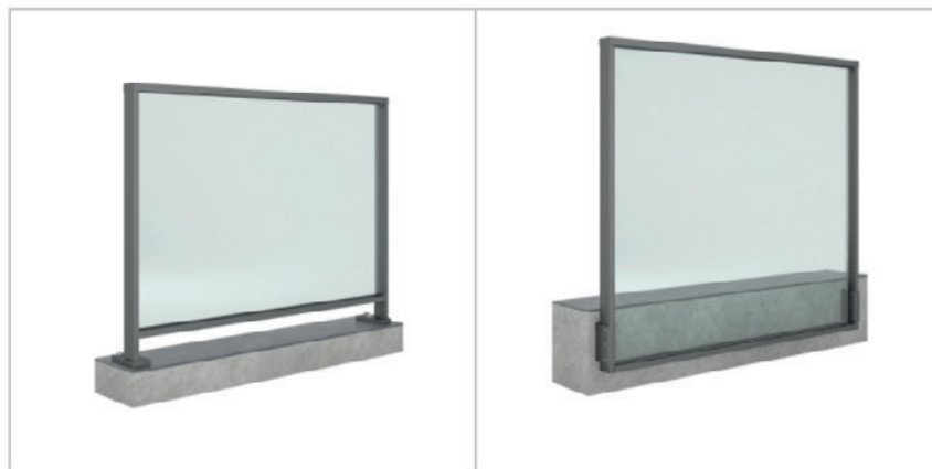
Modulo singolo_SP STANDARD

Le balaustre Modular sono progettate per un montaggio in cantiere rapido ed efficace : la posa è semplificata grazie allo sviluppo di un sistema brevettato a incastro, che rende possibile l'assemblaggio in sicurezza su tutti balconi. Ogni modulo può arrivare in cantiere pronto per la posa a vantaggio dei tempi realizzativi.