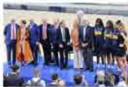
Passerella finale davanti ai fotografi