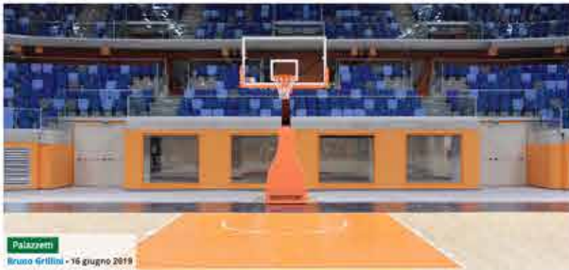
Palazzetti Bruno Grillini - 16 giugno 2019

Con il nome di Allianz Cloud, il nuovo palazzetto dello sport milanese è stato inaugurato venerdì 14 giugno alla presenza del sindaco Sala, del presidente del Coni Malagò, e tanti altri ospiti