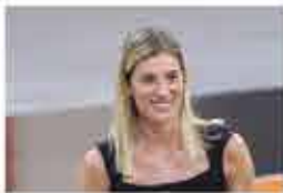
La pallavolista Francesca Piccinini