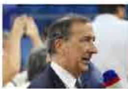
Il sindaco di Milano Giuseppe Sala