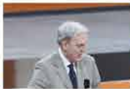
Il cestista Dino Meneghin