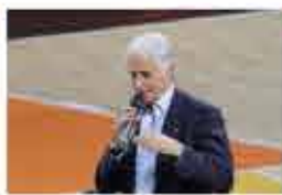
Il presidente del Coni Giovanni Malagò