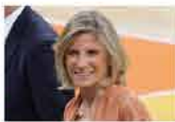
L'assessore allo sport del Comune di Milano Roberta Guaineri